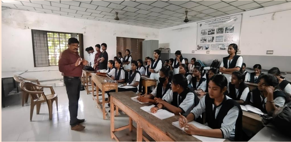
Principal's visit to classes