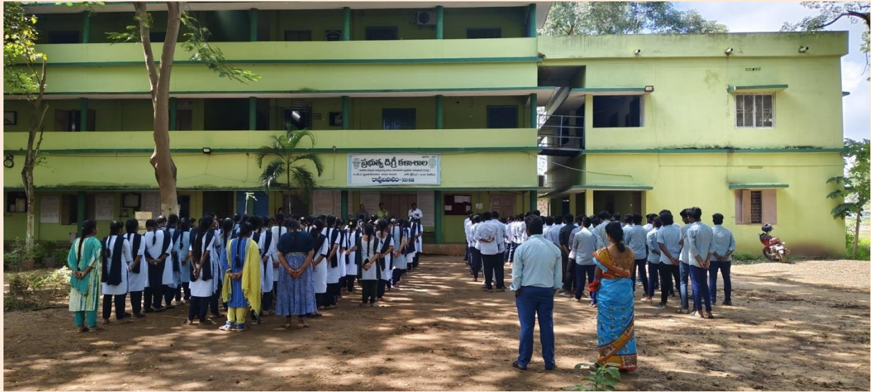
Students and Staff at General Assembly