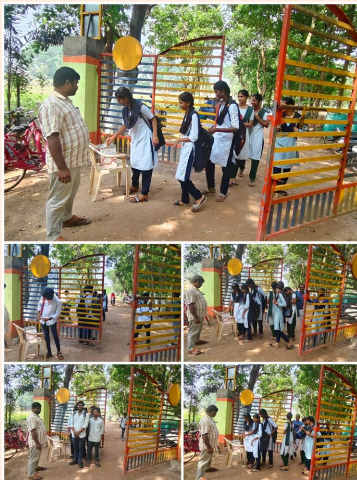
Late Comer Students Donating For Helping Hands